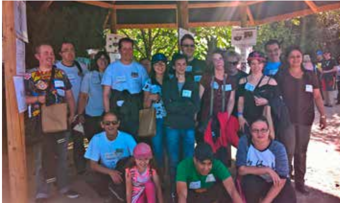
Les participants aux journées de l'expression

Le 25 septembre 2016 Inclusion a rassemblé ses membres et leur entourage au Monde Sauvage d'Aywaille lors de la traditionnelle Journée des Familles : spectacles animaliers, safari, bêtes à poils en pagaille et gourmandises au programme !