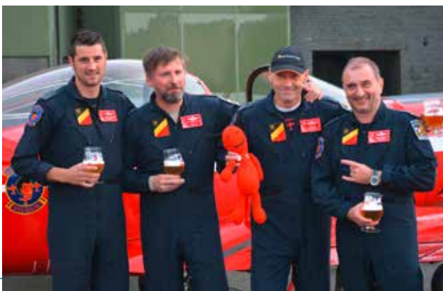
Les généreux donateurs rassemblés. Levons-leur notre verre !