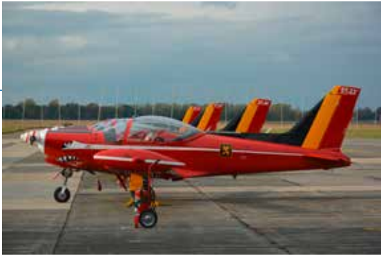
Les Marchetti utilisés par les Red Devils